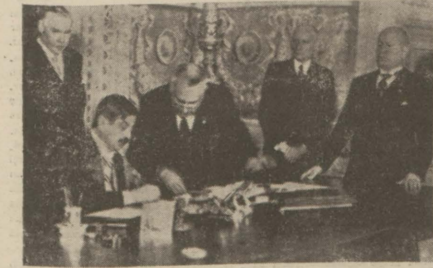
Laval harbinden evvel Fransız - İtalyan anlaşmasını imza ederken

İtibaren: İskonto haddi % 4 altın üzerine avans % 3